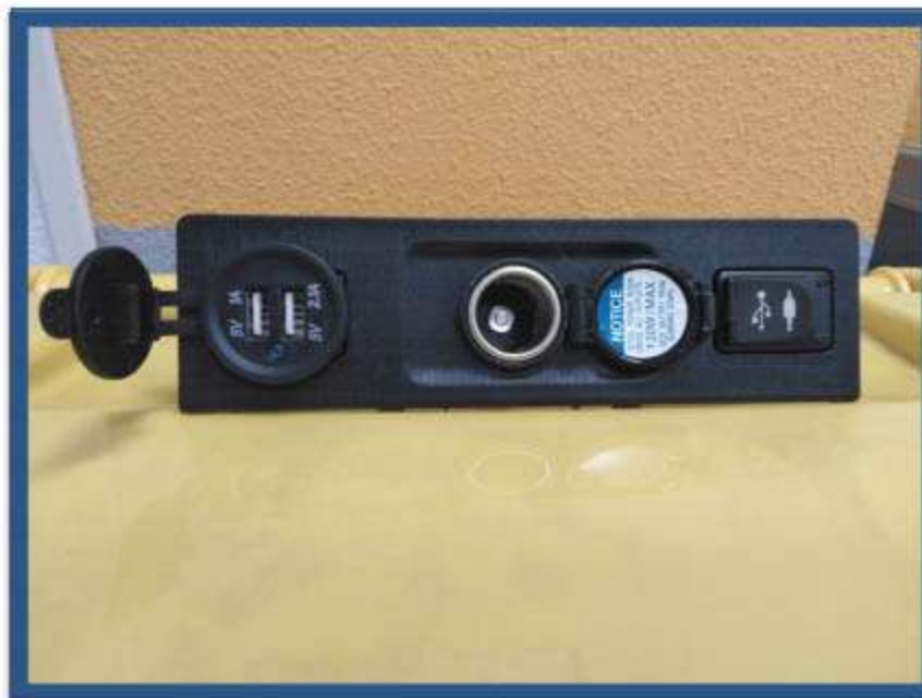
INSTALACIÓN TOMA USB ADICIONAL