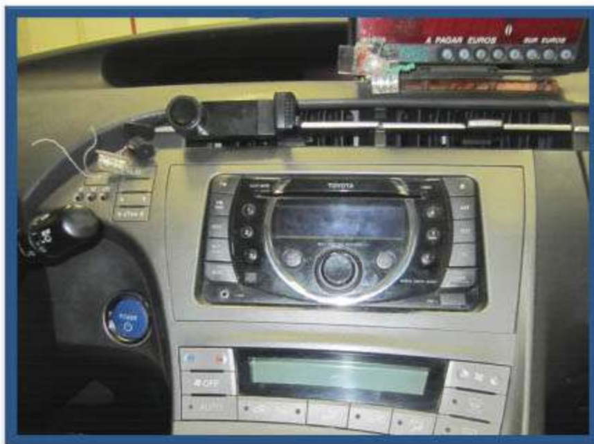
EQUIPO ORIGINAL DE TOYOTA PRIUS