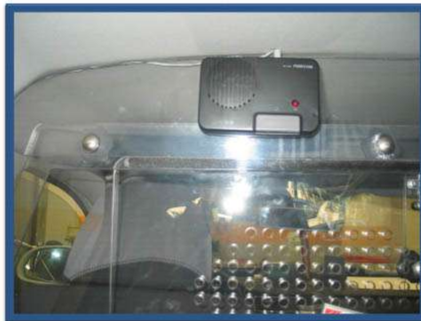
INSTALACIÓN INTERCOMUNICADOR PASAJERO