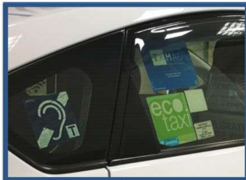
IDENTIFICACIÓN VEHICULO DOTADO CON BUCLE MAGNÉTICO