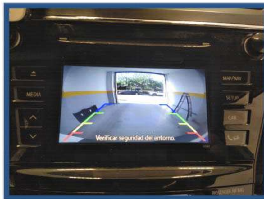
IMAGEN CÁMARA FULL HD DE VISIÓN TRASERA