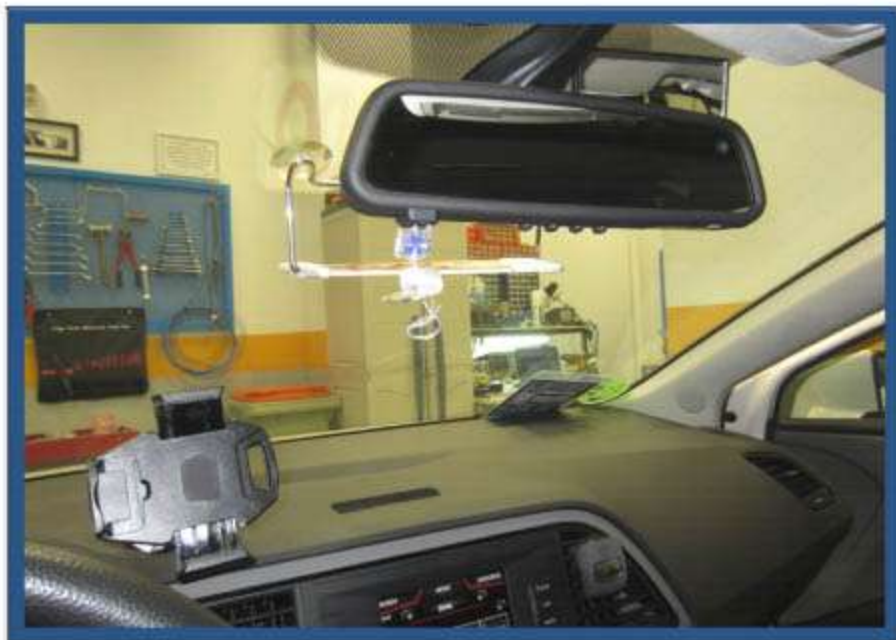
INSTALACIÓN TAXÍMETRO DE ESPEJO HALE SPT-02