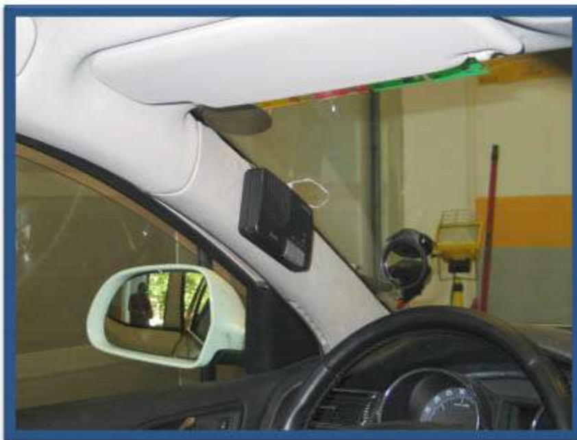
INSTALACIÓN INTERCOMUNICADOR CONDUCTOR