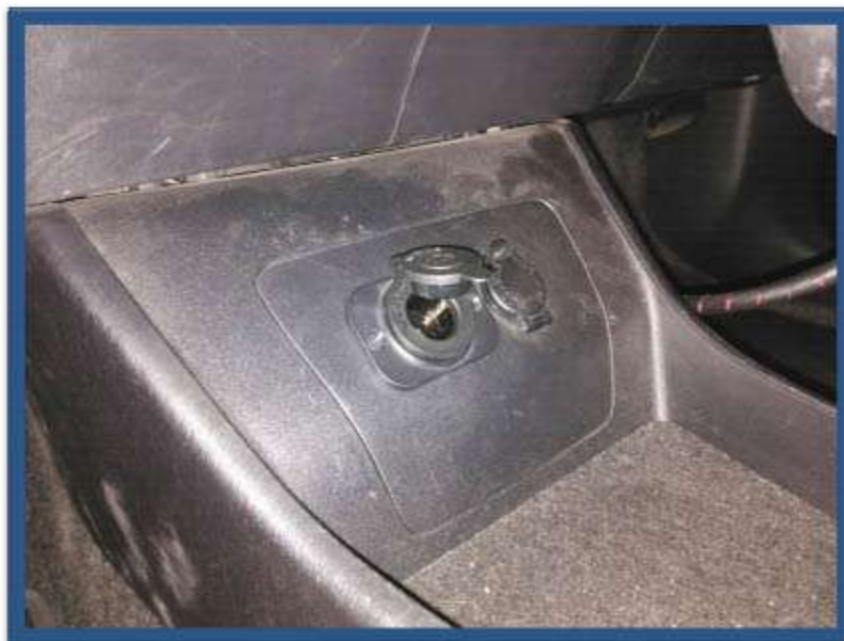
INSTALACIÓN TOMA DE MECHERO ADICIONAL