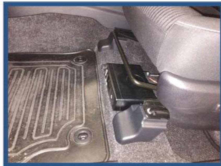
INSTALACIÓN EMISORA BAJO ASIENTO