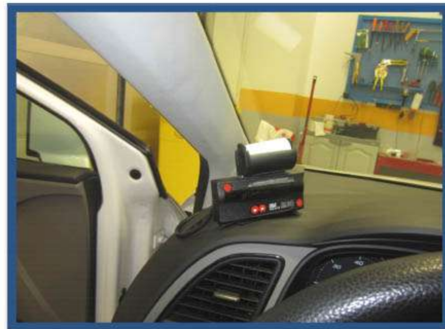
INSTALACIÓN IMPRESORA HALE