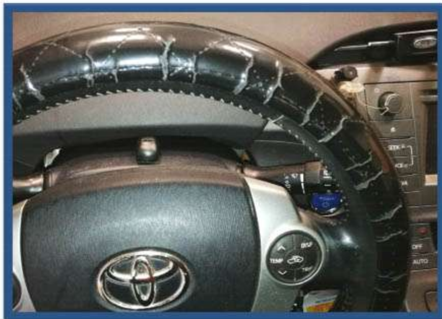
INSTALACIÓN MICRÓFONO DE BUCLE MAGNÉTICO SOBRE VOLANTE