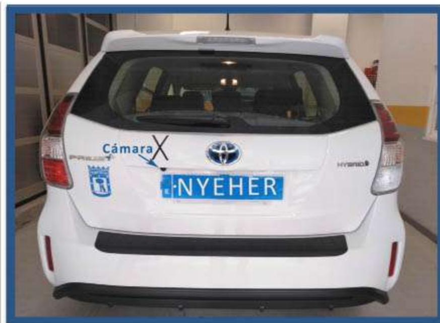
INSTALACIÓN CÁMARA VISIÓN TRASERA EN PRIUS+