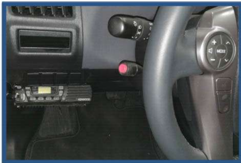
INSTALACIÓN EMISORA JUNTO A VOLANTE CON MANOS LIBRES